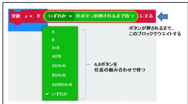
図3 開発したイベント処理拡張ブロック

使用するとする。micro:bitにもイベントの発生を検知するブロックがあり、そのブロックを用いるとScratchのプログラム同様にボタン入力処理を記述できるが、イベントが発生するまでループして待つという処理を書く必要があり、フローチャートとの対応が崩れてしまい学習者の理解の妨げになる。そこで、今回、イベントの入力(8つ)を待つ拡張ブロックを開発した(図3)。このブロックを使うとmicro:bitでも図2のフローチャートに対応したプログラムがScratch同様に実装でき、Scratchからmicro:bitへの接続性を保つプログラミング指導ができると考える。